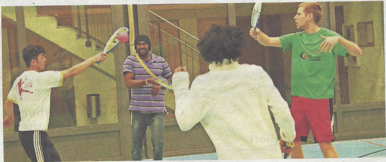
Die Asylsuchenden vom Mattenbach sind mit Begeisterung und Interesse dabei.

Mattenbach Vor Weihnachten 2015 ging die Asylunterkunft im Schulhaus Mattenbach auf. Mittels Flyer wurde ebenfalls die Bevölkerung orientiert. Da im Mattenbach-Quartier auch János Rumpel, Präsident des Smolballclubs Winterthur wohnt, wurde er auf die Neu-Unterkunft für Flüchtlinge im Schulhaus Mattenbach aufmerksam. «Eigentlich wollten wir gleich-